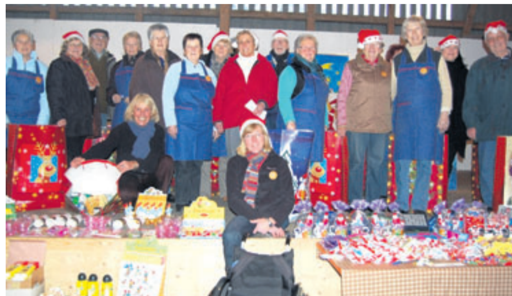
Die ehrenamtlichen Helfer der Ausgabestelle Bassen der Achimer Tafel haben ihre Kunden bei der jüngsten Lebensmittelausgabe mit Weihnachtsgeschenken überrascht.

Infos zur Hörzeitung unter Telefon: 0421/36716699 Bestellung im Internet unter www.weser-kurier.de